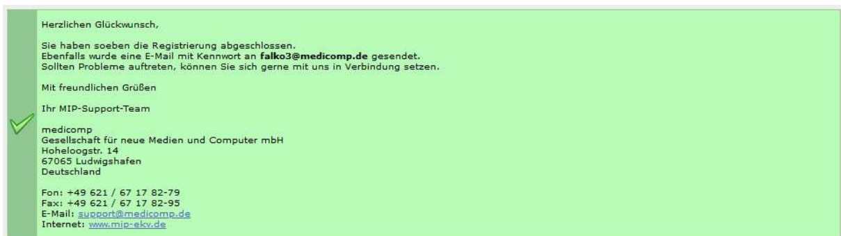
Abbildung 5 Erfolgreiche Registrierung Haupt-IK

Mit dem Klick auf den Aktivierungslink des Haupt-IK lösen Sie Ihre Freischaltung in MIP-Hilfsmittel-Management aus. Sie erhalten eine entsprechende Meldung (Abbildung 5). Bitte beachten Sie, dass der in der Aktivierungsmail enthaltene Link hat eine Gültigkeit von 3 Tagen hat.