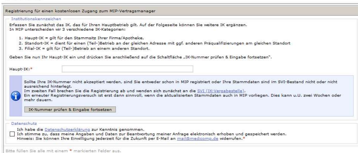
Abbildung 1 Erfassung Haupt-IK

Solange das Haupt-IK nicht korrekt eingegeben wurde, erhalten Sie die folgende Information: