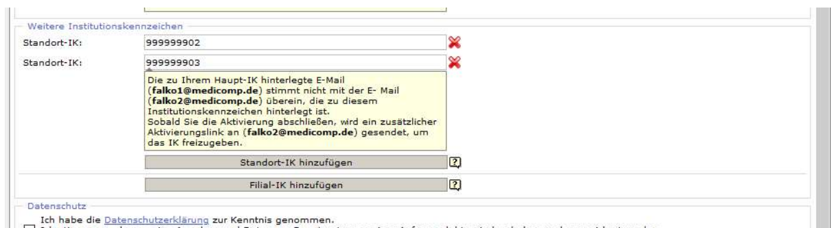
Abbildung 3 Weitere Institutionskennzeichen

Sie können nun bei Bedarf Ihre Standort- und Filial-IKs hinzufügen. (Abbildung 3)