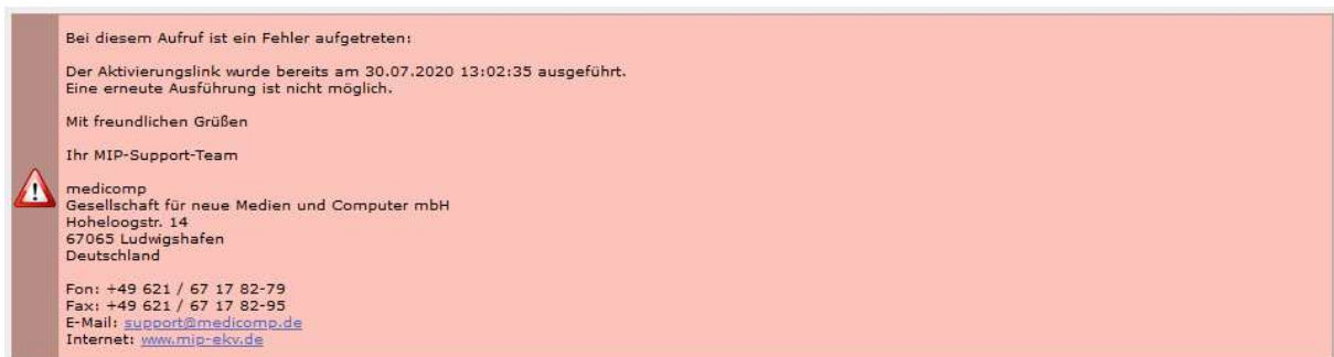
Abbildung 6 Fehlermeldung bei Aktivierung Haupt-IK

Wurde der Aktivierungslink bereits ausgeführt oder ist die Gültigkeit des Links bereits abgelaufen, ist eine Aktivierung nicht mehr möglich (Abbildung 6).