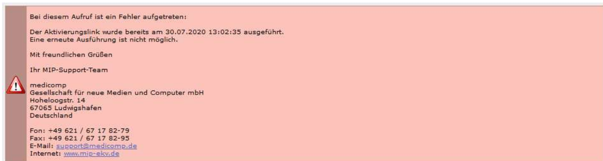
Abbildung 8 Fehler bei Aktivierung weitere IK

Wurde der Aktivierungslink bereits ausgeführt oder ist die Gültigkeit des Links bereits abgelaufen, ist eine Aktivierung nicht mehr möglich (Abbildung 8).