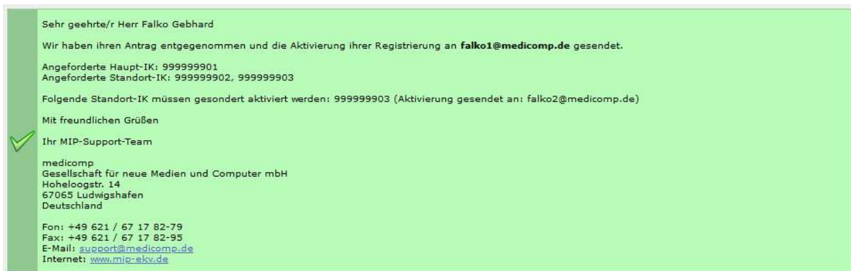
Abbildung 4 Erfolgreiche Datenerfassung

Nach erfolgreicher Eingabe aller Daten erhalten Sie eine Erfolgsmeldung. (Abbildung 4). Diese können Sie sich bei Bedarf über die Druckfunktion Ihres Browsers auch ausdrucken.